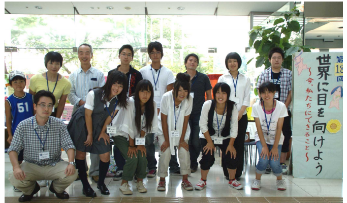
子どもから大人まで、参加しながら学べます！！