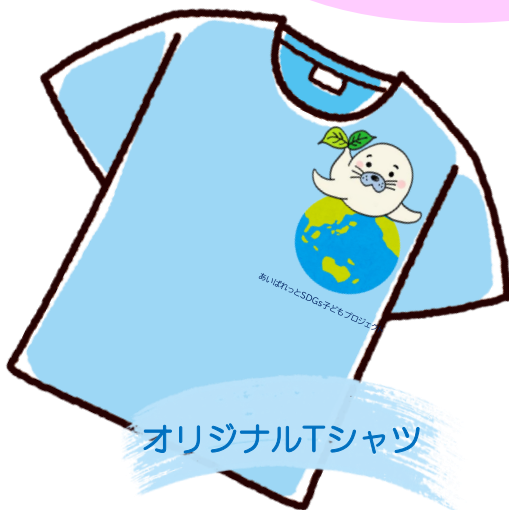
オリジナルTシャツ