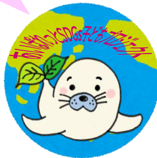
オリジナル缶バッジ